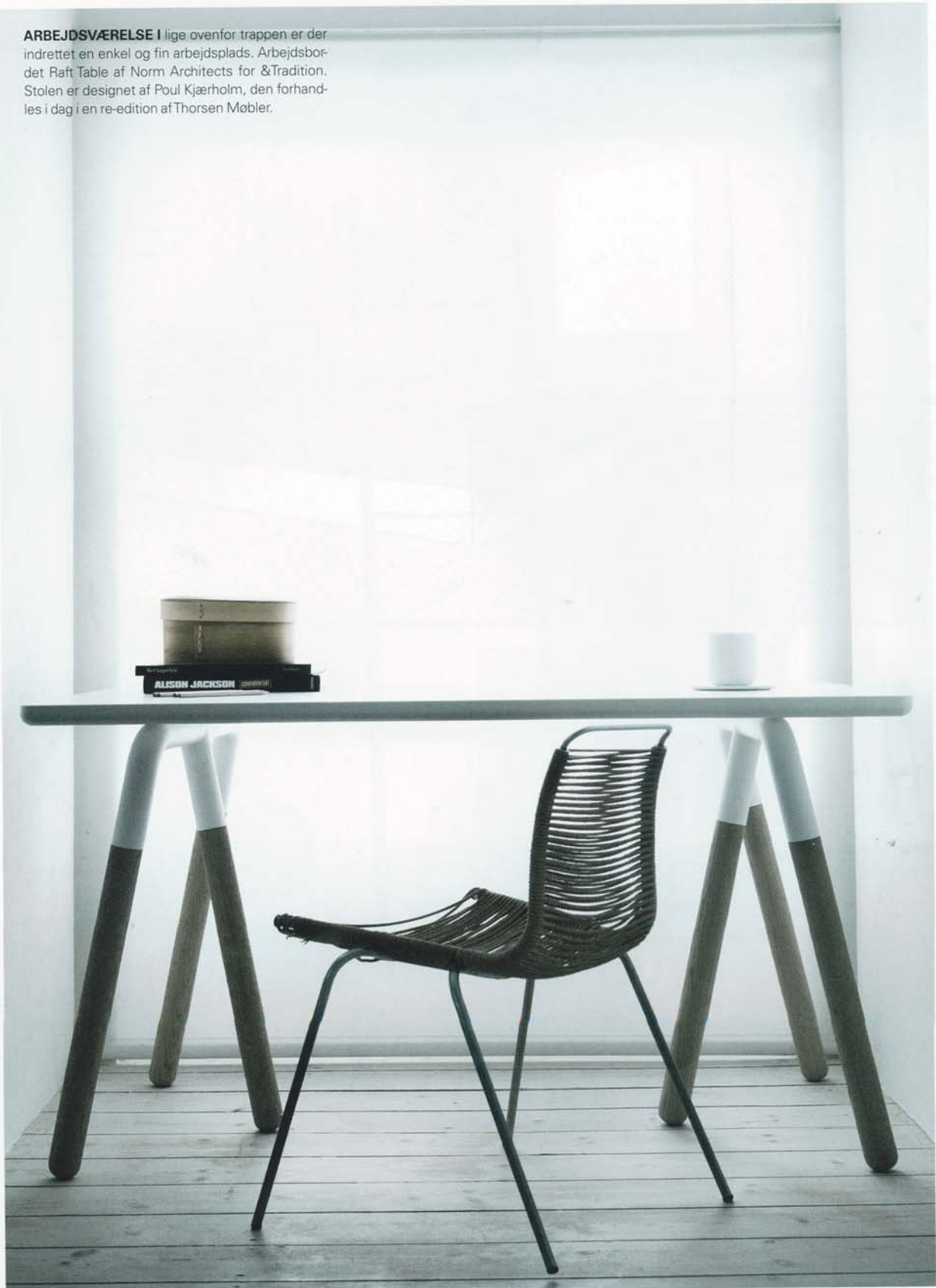
PHOTO: JENS JENSEN FOR RUM STYLING: THE SOURCE, 19200 WWW.SOURCEPHOTO.COM

ARBEJDSVÆRELSE I lige ovenfor trappen er der indrettet en enkel og fin arbejdsplads. Arbejdsbordet Raft Table af Norm Architects for &Tradition. Stolen er designet af Poul Kjærholm, den forhandles i dag i en re-edition af Thorsen Møbler.