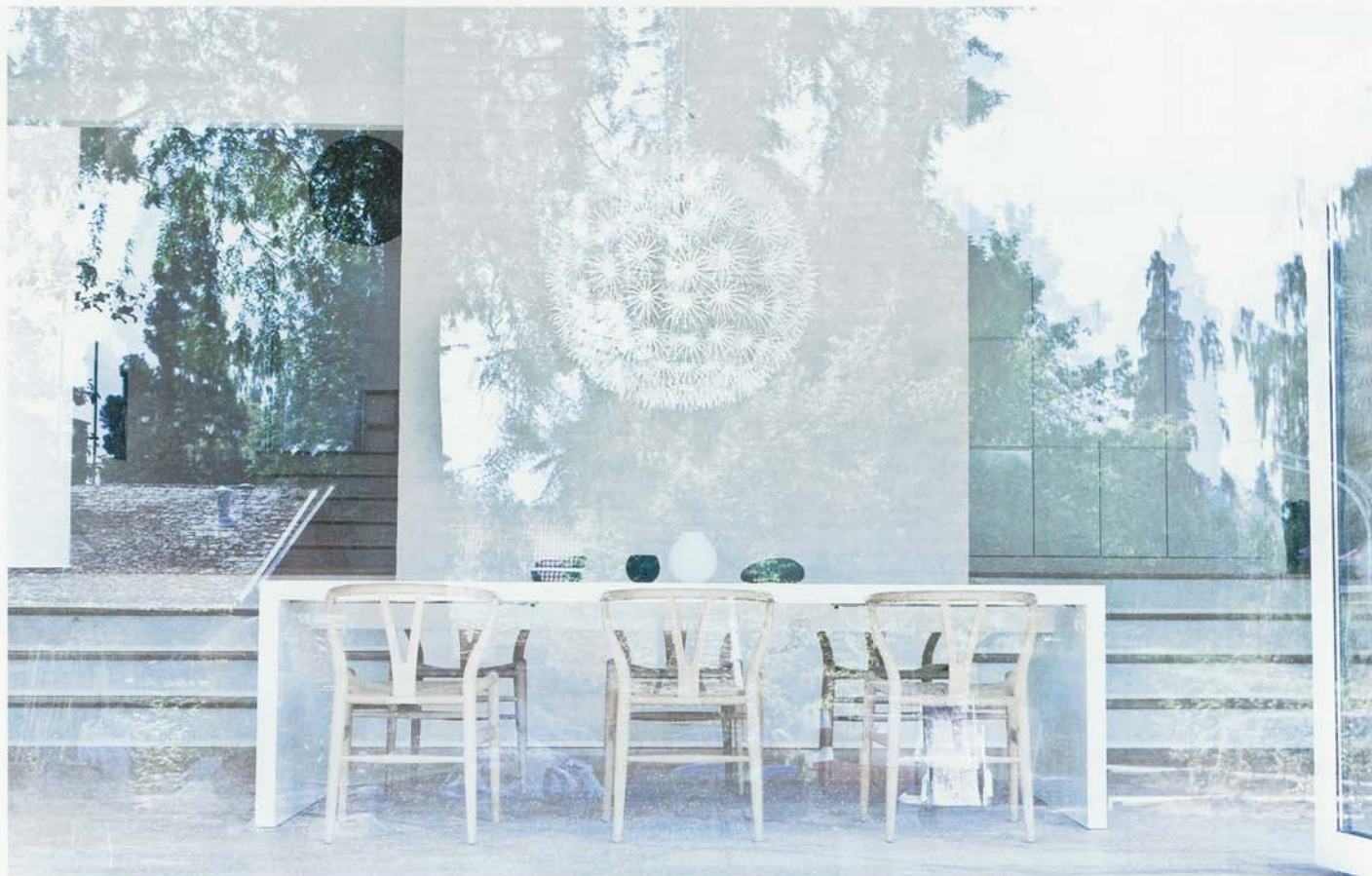
Texto: Isabel Rey.

En una inclinada propiedad del norte de Copenhague, la Fredensborg House está construida sobre cinco pequeñas mesetas, conectadas con escalones, que reflejan la superficie del terreno que la envuelve. La estética de la casa deriva de la inspiración que aporta la laberíntica arquitectura de este pueblo de montaña a los autores del proyecto, Jonas Bjerre-Poulsen y Kasper Rønn, que evoca la que se puede encontrar en lugares parecidos del sur de Europa, en la arquitectura de los templos chinos y en los trabajos de la arquitectura modernista danesa de Jørn Utzon.